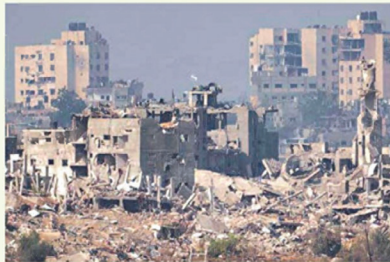
דגל ישראלי מתנוסס על גגן שטרם נצטנן רצועת עזה (חילום א.א.פ.)

אנתנו עכשיו בלחימה עיקשת. האויב נוסח לנוב בנו. ננסחי עד המטר האחרון. אני יכול לומר בצורה ברורה שממשך להקדים מקבצ שאנתנו חושבים לנסן. גנעז למרכזי הוכבר של החמאס. לרונגמא, כמצע 17 נהרגו המון מחבלים. מה שיש למצויר לא דומה למכצעים שהיו סמס. אין יותר חמאס מורעז. זה צריך להיות אין חמאס. זה בהשתנות. אנתנו נפגע בתמאס ללא ררין, זה הלונגיקה. בחלק מהמקומות ניקח