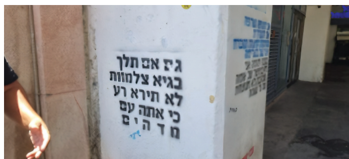
גרפיטי, בניין כלל ירושלים